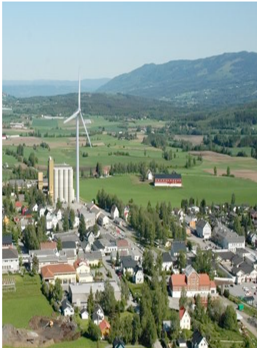
Kornsiloen på Lena blir liten ved siden av en av Havguls vindturbiner...